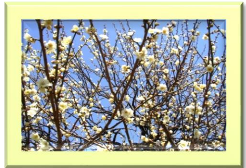
3月 湯島天神の梅まつり