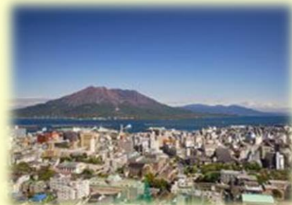
城山(から見た風景)