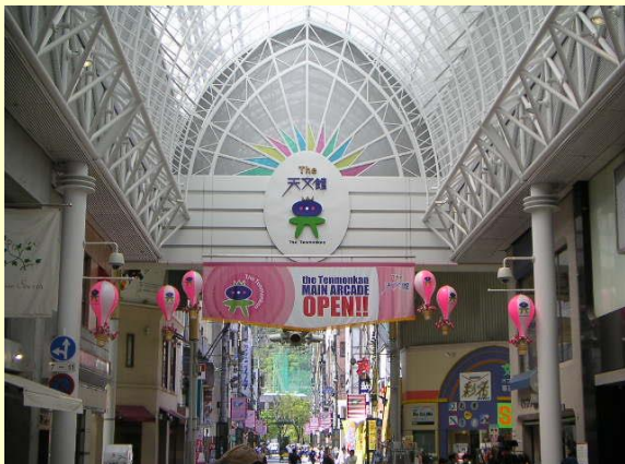
昼の天文館 なかなかきれいな街です。 結構にぎやかだし。

市内観光が終わったらいよいよ天文館ですよ。 小生これが楽しみで今回の旅行に参加したのですから！！