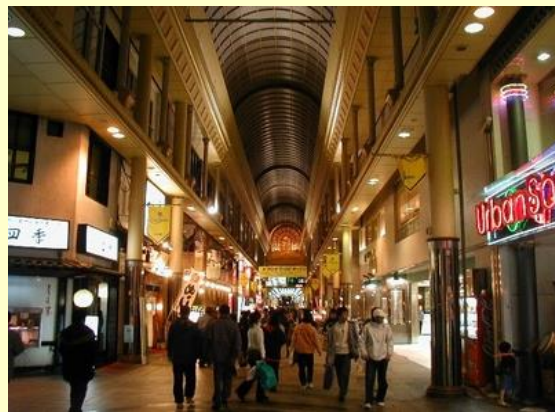
夜の天文館 む～ こんなもんかな